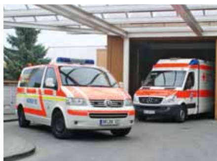
Rettungsdienst und Krankenhaus, bei der Notaufnahme ist der funktionierende Dialog wichtig.

NOTFALLMEDIZIN Das Kreiskrankenhaus Bergstraße und die Rettungsdienste intensivieren den Dialog: Erstmals ist in der Heppenheimer Klinik kürzlich ein Notfallsymposium veranstaltet worden. Das Symposium dient der fachspezifischen Schulung und ist zugleich Forum zur Kommunikation und damit auch ein Angebot zum persönlichen Kennenlernen von allen an der Notfallversorgung Beteiligten. Die Veranstaltung in den Räumen des Kreiskrankenhauses war Auftakt einer Reihe: Die Klinik will künftig regelmäßig Notfallsymposien anbieten. Im Wechsel werden je zwei Bereiche sich selbst oder Schwerpunkte ihrer Arbeit vorstellen.